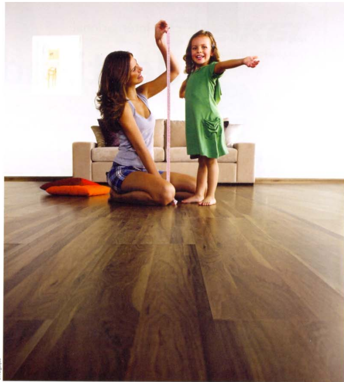
Pisos laminados Eucafloor

foi uma das primeiras de seu segmento a conquistarem o Selo Verde. Os pisos Eucafloor são produzidos com o exclusivo HPP, um substrato de partículas de eucalipto 100% reflorestado, proveniente de florestas certificadas com Selo Verde, da SCS (Scientific Certification Systems). O HPP apresenta revestimento duplo e não absorve substâncias ou organismos que transmitem alergias. A linha que será utilizada no projeto é a Elegance, destinada para ambientes residenciais e corporativos. Esta linha contém 12 padrões em régua larga de 135 X 30 centímetros: mont blanc, decapê blanche, legno claro, noqueira bilbao, carvalho madri, carvalho córdoba, bétula, teca brasil, noqueira rústico, carvalho sevilha, carvalho chamonix e o lançamento nogal gris. Recentemente os pisos laminados Eucafloor conquistaram o reconhecimento do PBQP-H (Programa Brasileiro de Qualidade e Produtividade do Habitat), o que atesta que são fabricados seguindo rigorosos padrões de qualidade, bem como as características